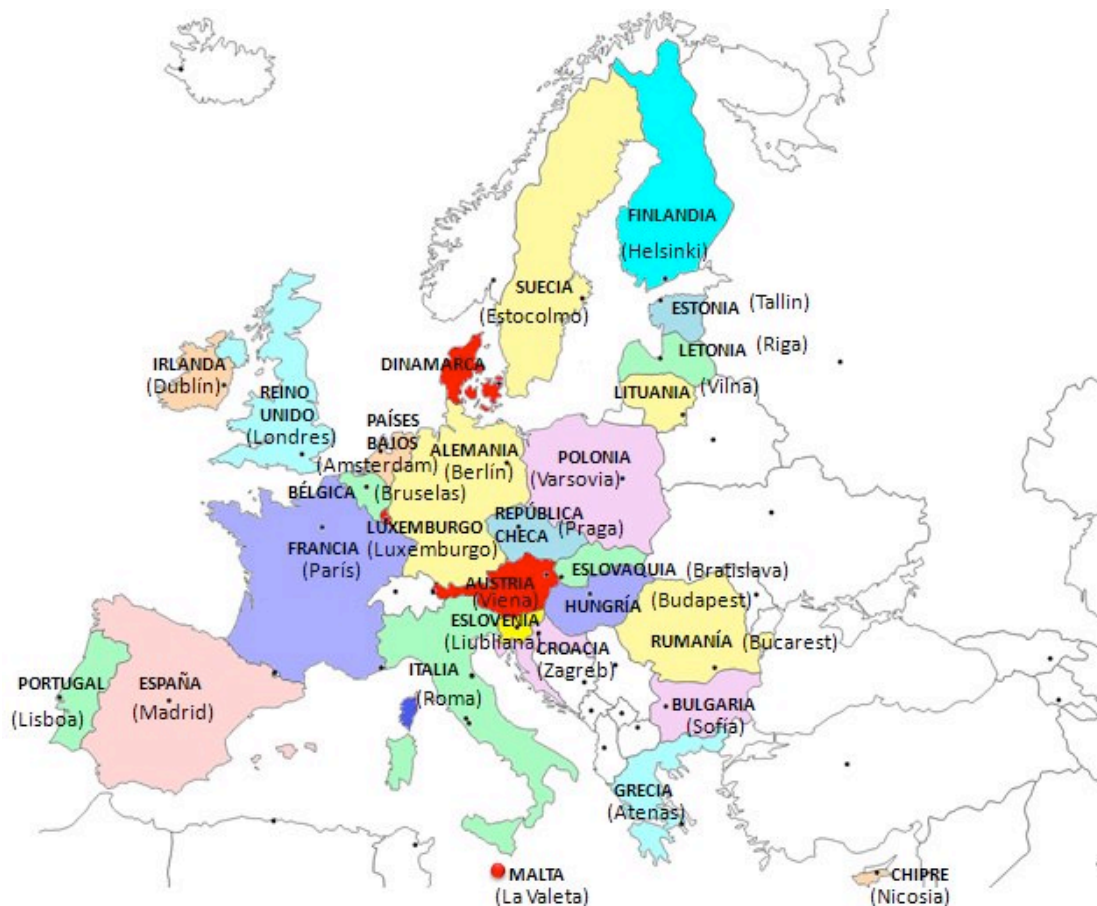
Países de la Unión Europea.

Italia, Bélgica, Países Bajos y Luxemburgo (1957), Dinamarca e Irlanda (1973) 1 , Grecia (1981), España y Portugal (1986), Austria, Finlandia y Suecia (1995), Chipre, Estonia, Hungría, Malta, Letonia, Lituania, República Checa, Eslovaquia, Polonia y Eslovenia (2004), Rumania y Bulgaria (2007), y Croacia (2013).