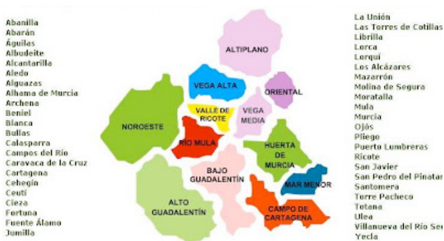
Comarcas de la Región de Murcia.

La Región de Murcia se convierte en Comunidad Autónoma el 9 de junio de 1982 tras aprobarse su Estatuto de Autonomía. Su territorio es uniprovincial (Provincia de Murcia) y se divide en 45 municipios y 66 diputaciones. Las comarcas que la componen son 12, pero responden más a criterios naturales y humanos: Altiplano, Alto Guadalentín, Bajo Guadalentín, Campo de Cartagena, Mar Menor, Huerta de Murcia, Noroeste, Oriental, Río Mula, Valle de Ricote, Vega Alta del Segura y Vega Media del Segura. Sus instituciones son las mismas que las referidas para el resto de Comunidades, en nuestro caso Asamblea Regional, Consejo de Gobierno, Presidente de la Comunidad Autónoma, Tribunal Superior de Justicia de la Región de Murcia y Defensor del Pueblo.